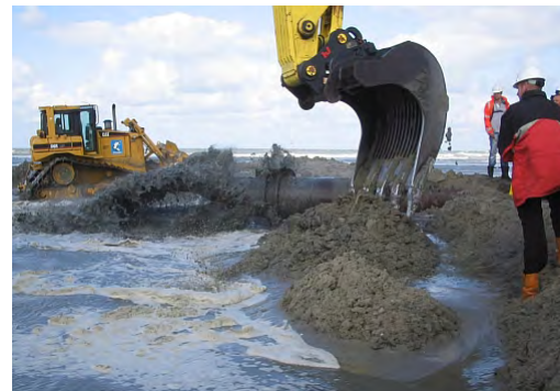
Start aanleg Maasvlakte 2