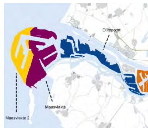
Europoort, Maasvlakte en Maasvlakte 2